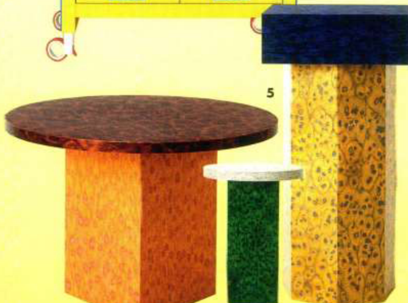
5/Tables basses "Osis Edition 5", design Lloa Lloa, panneaux de bouleau laqué, à partir de 1240 € en l. 45 x h. 32 cm, OSIS.