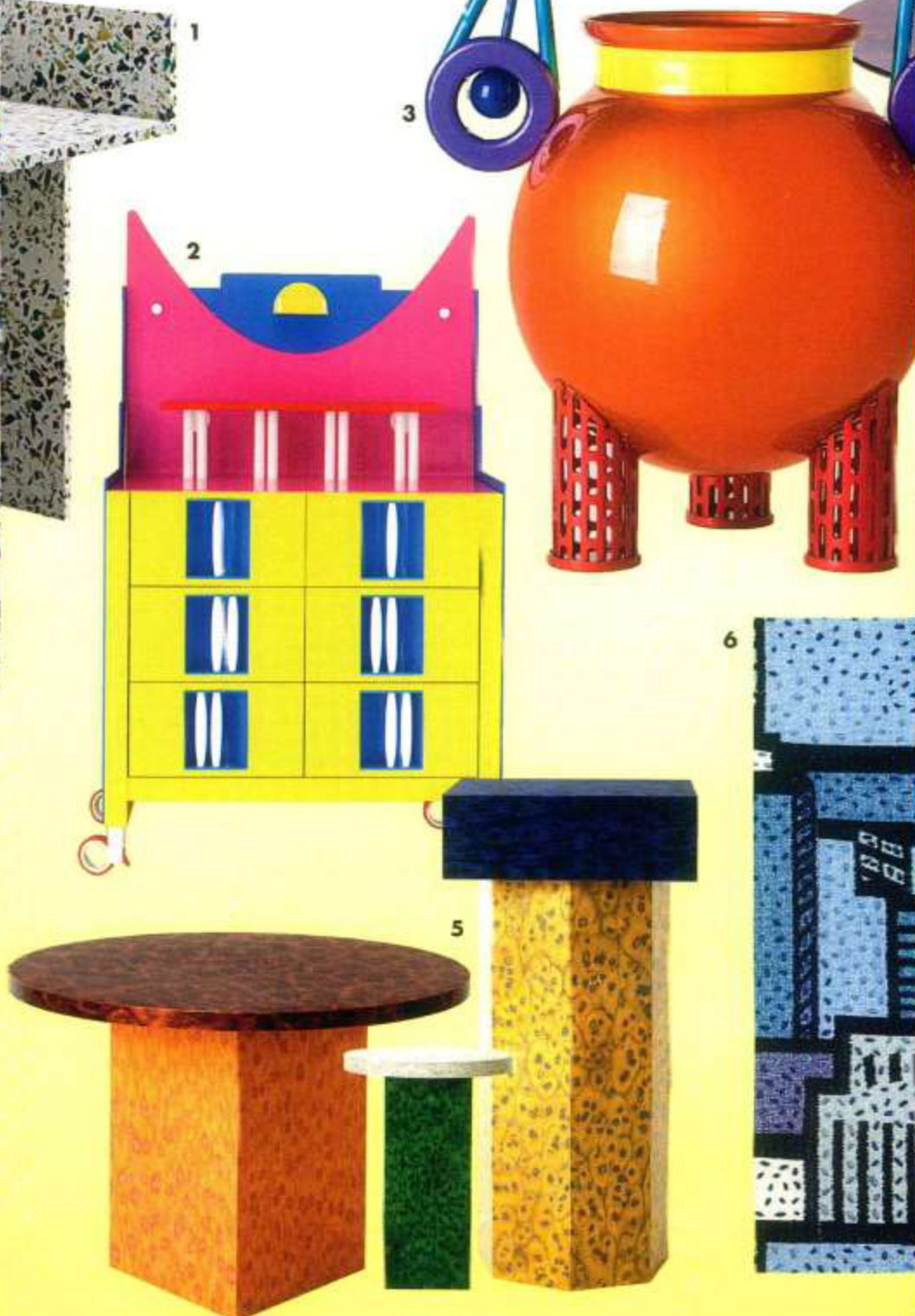
3/Sculpture "Juno" en aluminium, collection Raw & Rainbow, design Serena Confalonieri, édition limitée, l. 35 x h. 60 cm, 6000 €, ALTREFORME.